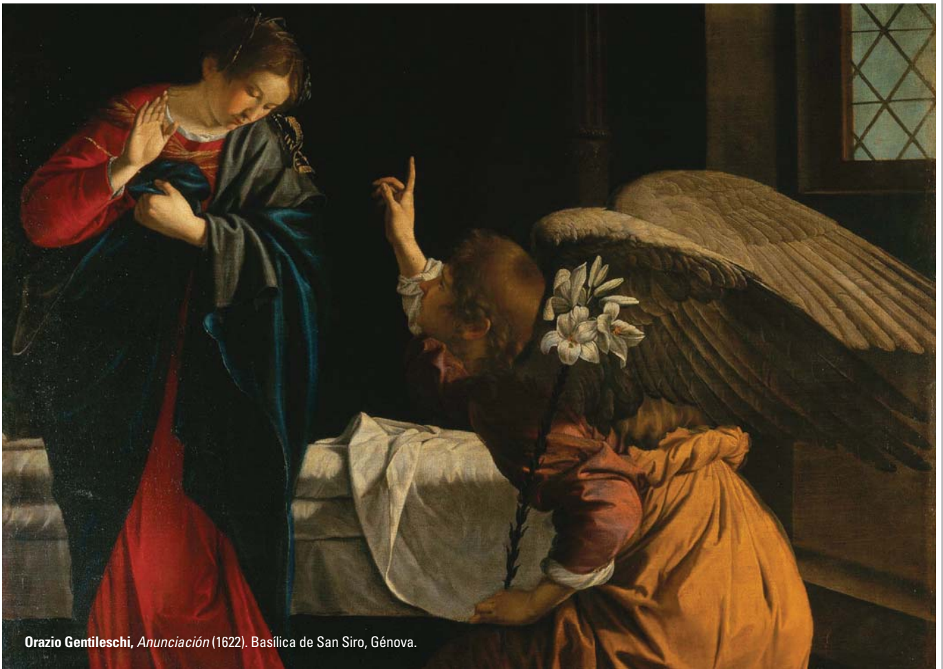
Orazio Gentileschi, Anunciación (1622). Basílica de San Siro, Génova.

cuenta de que toda la trayectoria educativa ha sido en primer lugar un juicio sobre la experiencia de este año, más que un reclamo a asumir una postura determinada. Hemos vivido muchas circunstancias que nos han puesto a prueba, nos han desafiado a tomar una postura original: o mantenemos el vínculo con nuestra “cepa”, con el origen de lo que nos ha alcanzado, o se convierte en una tentación irresistible dejar prevalecer el análisis o la reactividad.