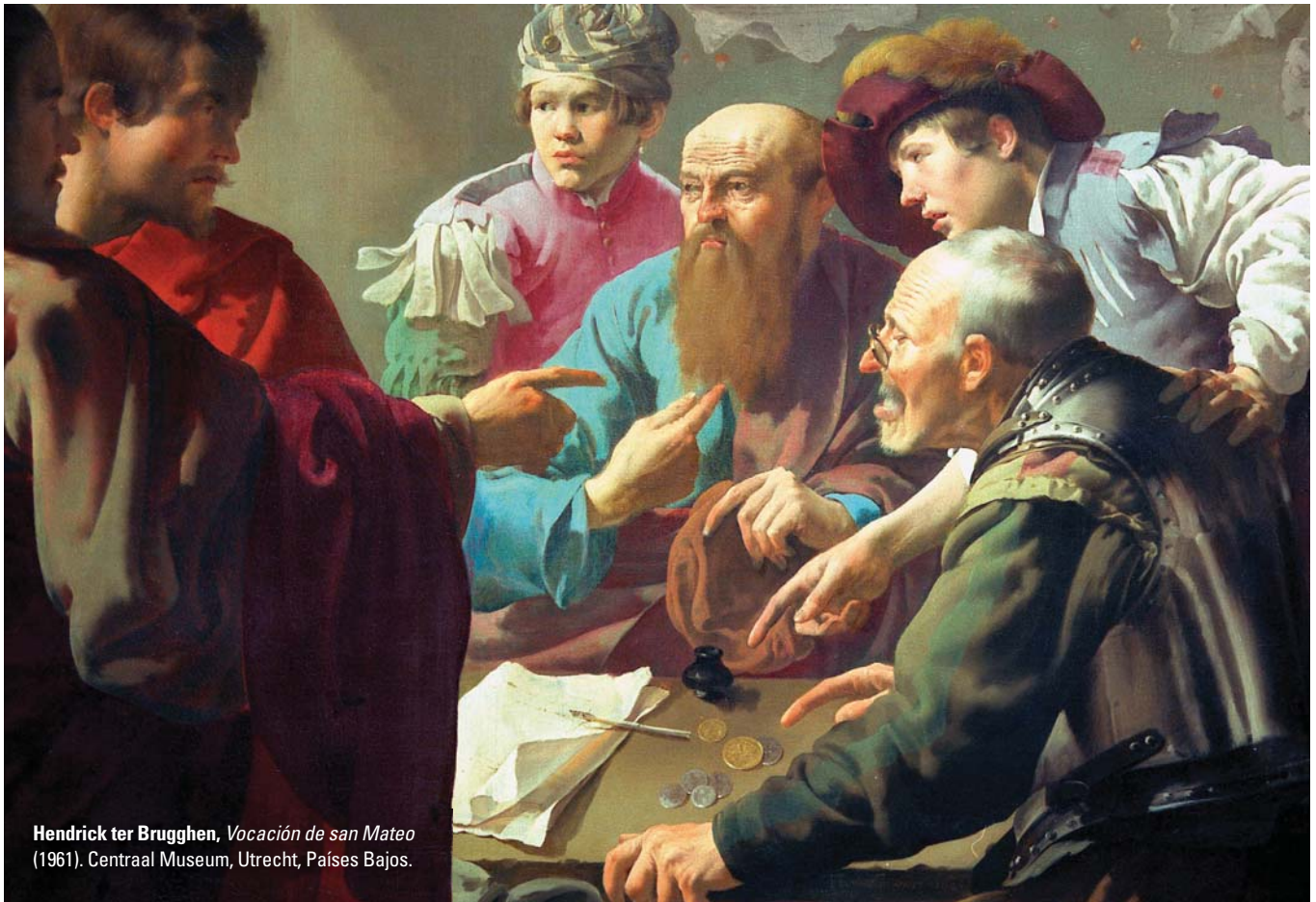
Hendrick ter Brugghen, Vocación de san Mateo (1961). Centraal Museum, Utrecht, Países Bajos.

bien, a fin de que cuantos más reciban la gracia, mayor sea el agradecimiento, para gloria de Dios» (2 Cor 4,7-15).