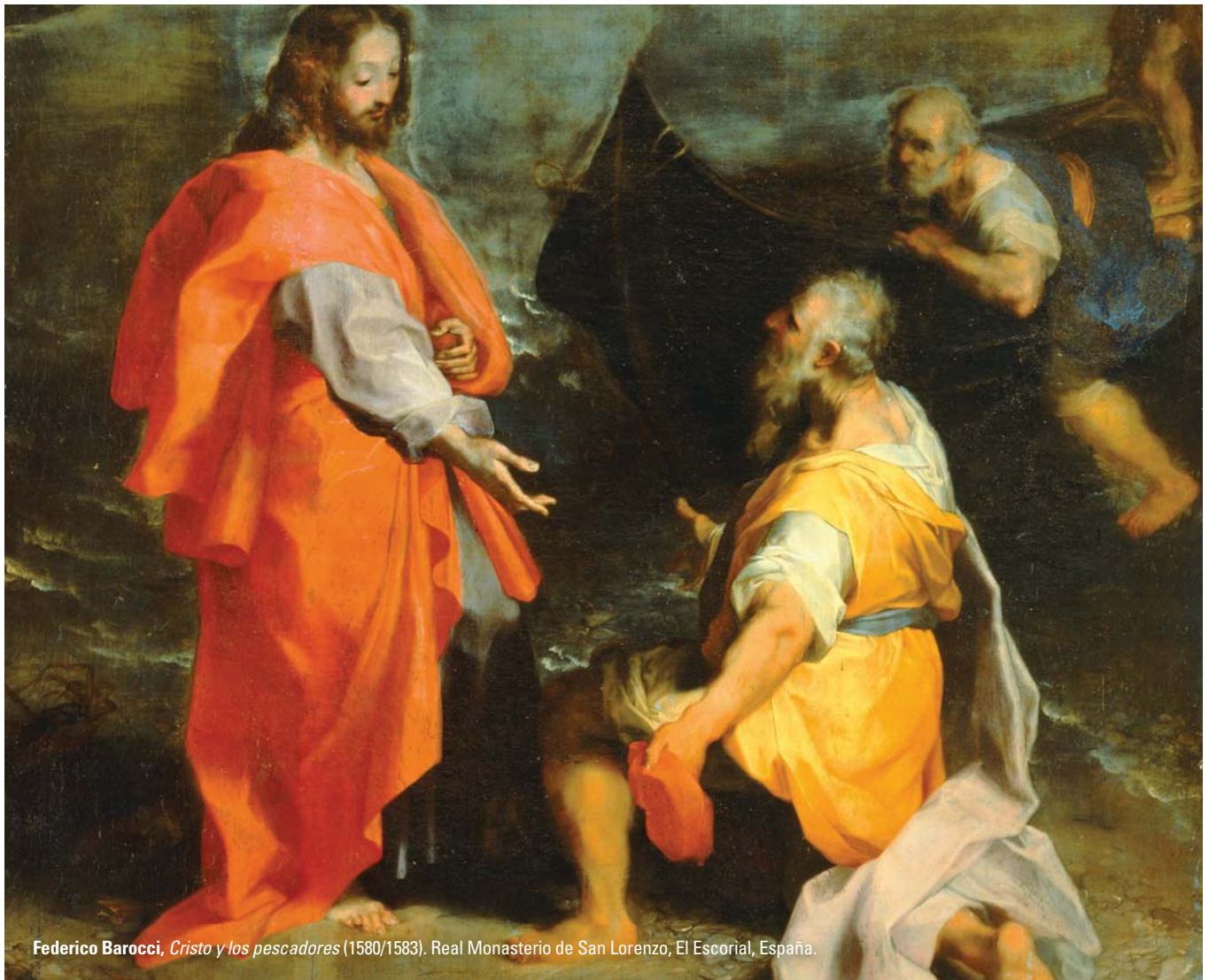
Federico Barocci, Cristo y los pescadores (1580/1583). Real Monasterio de San Lorenzo, El Escorial, España.