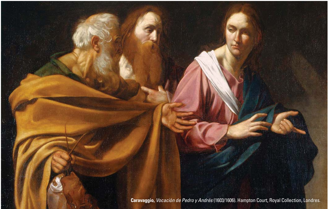
Caravaggio, Vocación de Pedro y Andrés (1603/1606). Hampton Court, Royal Collection, Londres.

cuenta de que mi imagen profesional “habitual” no aguanta, no encuentro asideros, mientras se reabren en mí las mismas preguntas que tiene ella, el mismo grito que tengo yo y que me llevo fuera de la habitación. Empiezo a intuir que no es problema de mi capacidad y que hay algo más [creemos que podemos arreglárnoslas con nuestra racionalidad científica, pero la realidad nos empuja, nos desafía despertando las mismas preguntas: ¡hay algo más!]. Esa mujer embarazada hace surgir de nuevo mi humanidad necesitada dentro de mi papel como profesional».