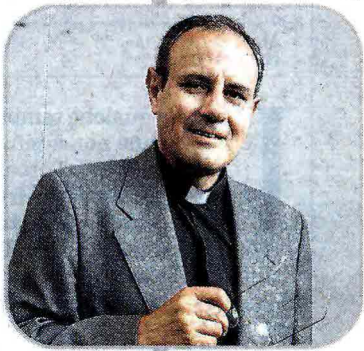
Julián Carrón, 64 anni, spagnolo, dal 2005 alla guida di CI